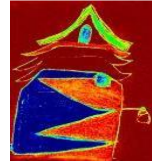
Art-thérapie en AMC ©